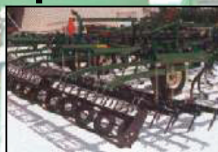
3 rangées de dents avec rouleau