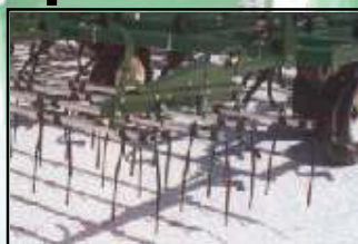
4 rangées de dents ressorts longues