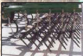
5 rangées petites dents