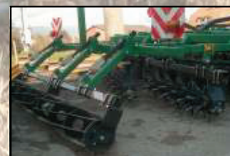
Niveleur à doigts avec rouleau