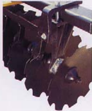
Ductile cast standard bearing hanger with regreasable flanged type bearing.

The Taylor-Way flex wing design delivers excellent cutting and superior leveling ability resulting in a "Taylor Made" finish. When it comes to quality craftsmanship at a price you can afford there is no better choice than the Taylor-Way Series 580 Flex Wing Tandem Disc Harrow. Trust the Taylor-Way Series 580 to make your job easy, providing excellent reliability in an implement made to last.