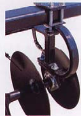
Optional 1" x 2" flexible steel hanger design to absorb shock load for increased bearing and axle life.

Extra Equipment Available: Gang Bolt Wrench Furrow Filler Scraper Furrow Filler Blades