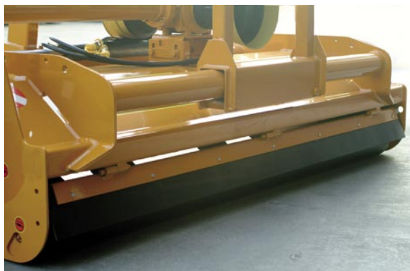
Rullo posteriore autopulente e regolabile in altezza Rodillo trasero regulable autolimpiable Rouleau postérieur auto-nettoyant, réglable en hauteur