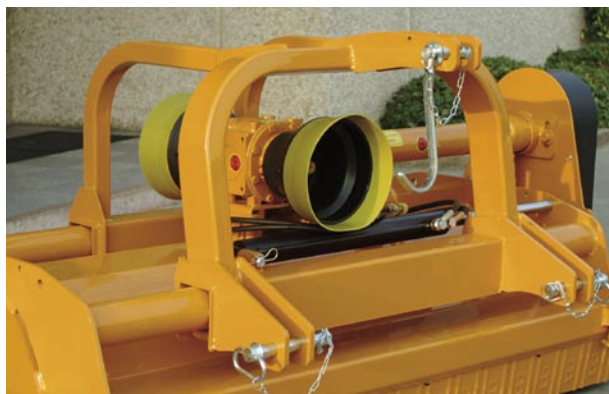
Attacco a tre punti reversibile e spostabile lateralmente Enganche reversible a los tres puntos Attelage déportable et réversible